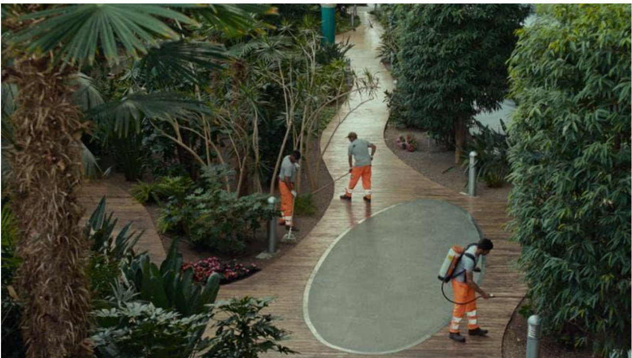
I giardinieri che lavorano all'Ospedale dell'Angelo di Mestre

Il progetto vi ha fatto viaggiare in tutto il mondo. Un aneddoto particolare da svelare? «A marzo dello scorso anno siamo andati in Texas e ci siamo imbattuti in una specie di tempesta tropicale, un segnale come a voler rafforzare l'importanza del tema climate change . Ne ho un secondo: ci siamo resi conto che è diventato anche un film sui giardinieri. Con il loro importante lavoro sono diventati i grandi protagonisti inaspettati del nostro documentario».