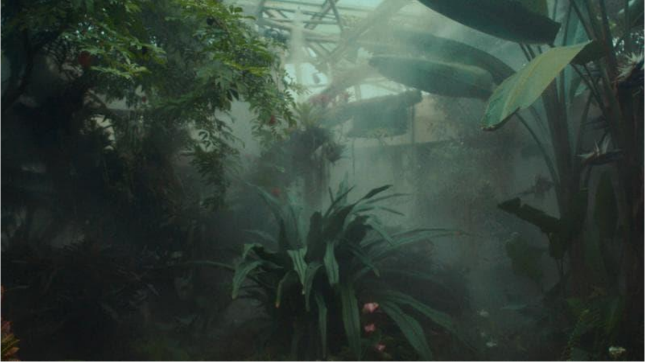
Il giardino Botanico di San Antonio, in Texas, al cui interno sorge il Lucille Halsell Conservatory

Infine, l'Ospedale dell'Angelo di Mestre (2008, Italia - ndr ), un progetto studiato in modo tale che ogni stanza possa godere di un affaccio sul verde. È provato scientificamente infatti, come evidenzia Stefano Mancuso nel documentario, che i pazienti che riescono a passare del tempo in mezzo alla natura guariscono prima, anche in ospedale».